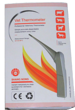
製品番号：KD818 獣医用電子体温計 30秒即温