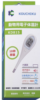
製品番号：KD815 獣医用電子体温計 10秒即温