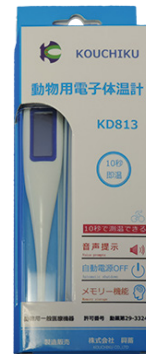
製品番号：KD813 獣医用電子体温計 10秒即温