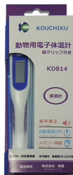
製品番号：KD814 獣医用電子体温計 実測